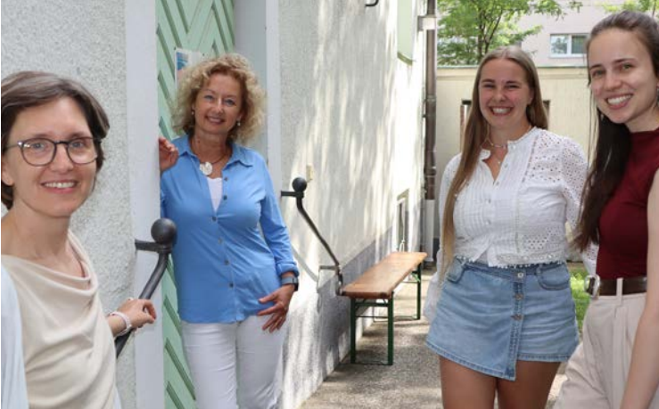
(Von links nach rechts)