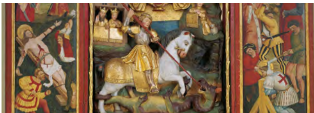
St. Georgs Kirche Altar