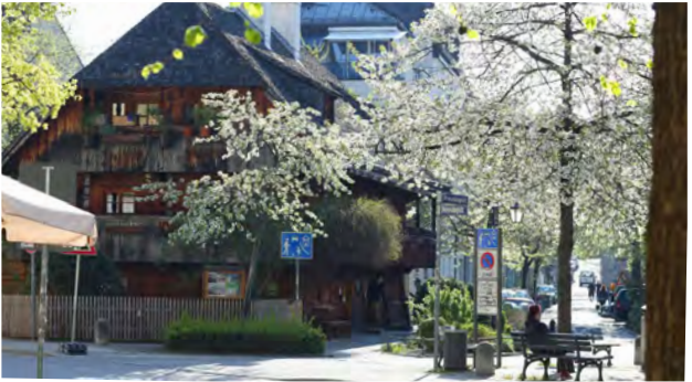
Kriechbaumhof Haidhausen