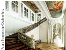
Palais Treppenhaus