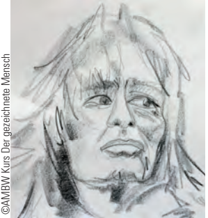
Kurs Der gezeichnete Mensch

Zeit 10.00 – 15.30 Uhr Ort Botanikum, Feldmochinger Str. 79, 80993 München Kursgebühr 269,- EUR Weitere Infos/Anmeldung > Kurs-Nr. 143283DZ (Link anklicken)